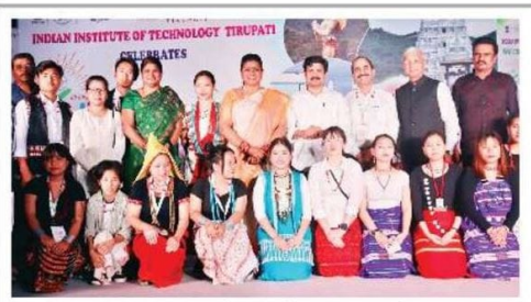
విద్యార్థులతో ఎంపీ, ఎమ్మెల్యే

ఏక్ భారత్ (శేష్థ భారత్ యువ సంఘం కార్యక్రమాన్ని జండా ఊపి ప్రారంభిస్తున్న మంత్రి రోజు, ఎంపీ గురుమూర్తి